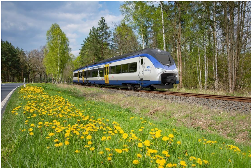
NEB-SiemensMireoPlusB